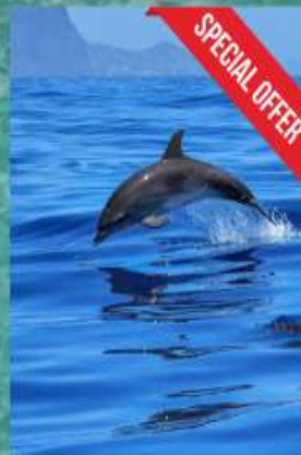
SPA 30 mins