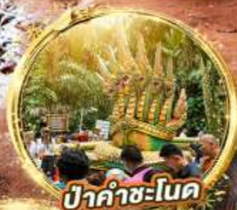
ป่าคำชะโนด