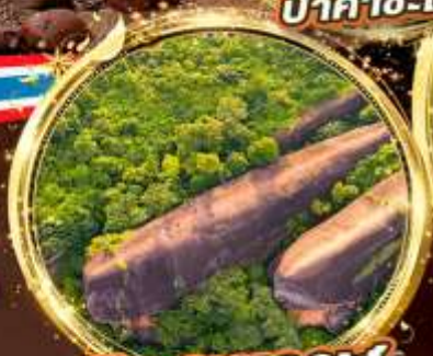
หินสามวาฬ