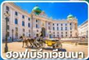
ฮอฟบวร์กเวียนนา