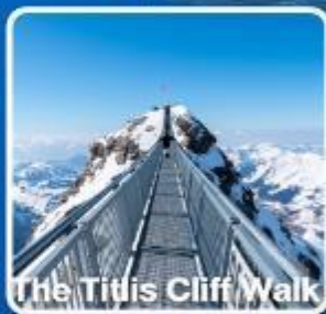
The Titlis Cliff Walk