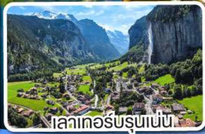
เลาเทอส์บรุนเนน