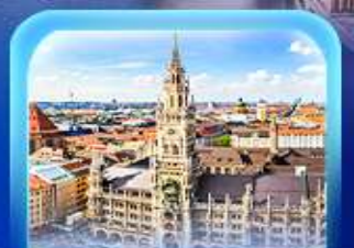
จัตุรัสมาเรียนพลาทซ์

เวียนนา ปราสาทนอยชวาสไตน์ ลูเซิร์น เซอร์แมท ชุก ซูริก