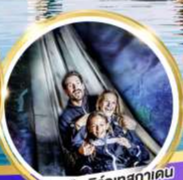
เหมืองเกลือบิรท์เทสกาเดิน