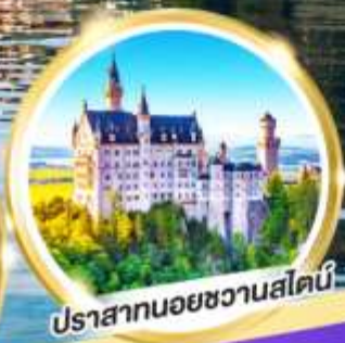
ปราสาทนอยชวานสไตน์