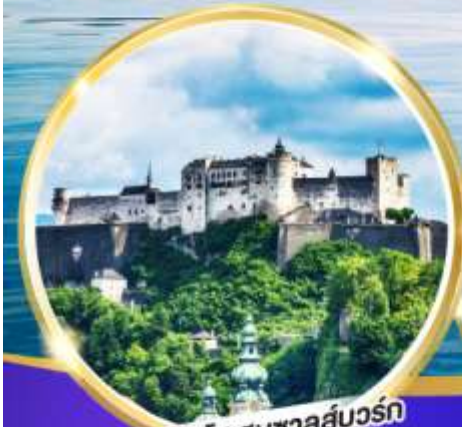
ปราสาทไฮเซนซาลส์บวร์ก