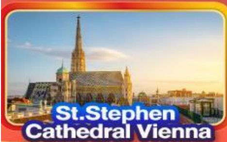
St. Stephen Cathedral Vienna