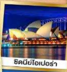
ซิดนีย์โอเปร่า