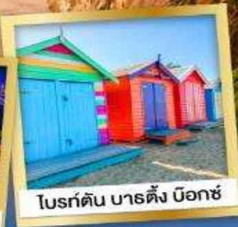
ไบรด์ตัน บาร์ดิง บ็อกซ์

03-10, 12-19 เม.ย.68 24 เม.ย.-01 พ.ค.68 08-15, 22-29 พ.ค.68 29 พ.ค.-05 มิ.ย.68