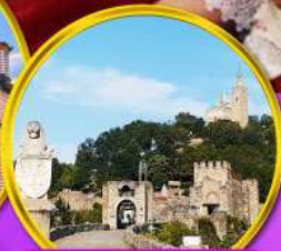
ป้อมชาเรเวทส์