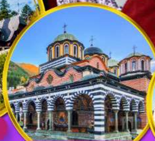
อารามมรดกโลกริลา