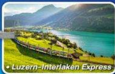
• Luzern-Interlaken Express