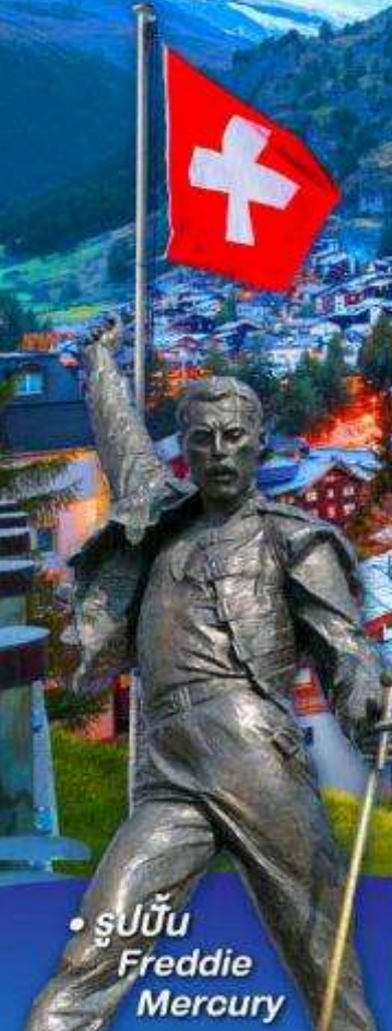
• รูปปั้น Freddie Mercury

พีชิต 5 เวกริก, เวกฮาร์เคอร์คุม, เวกจุงเฟรา เวกลาเซียร์ 3000 และ เวกรอนเนอร์แกรต