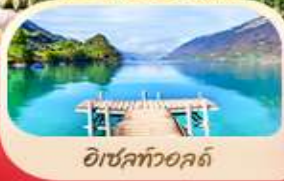
อีเซลท์วอลด์