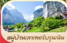
หมู่บ้านเลาเทอร์บรุนเนน