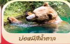
ปอดมีสีน้ำตาล