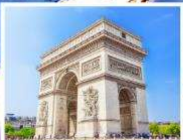
ประตูลีปารีส