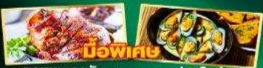
หมูพะเทศ พาหมูเยอรมัน หอยแมลงภู่อิ่มใจ