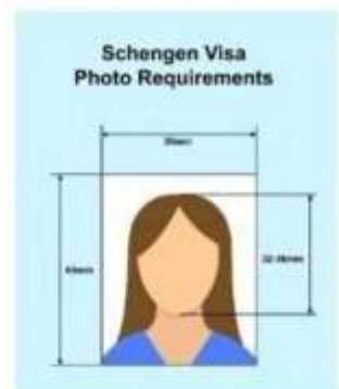
ตัวอย่างรูปถ่าย