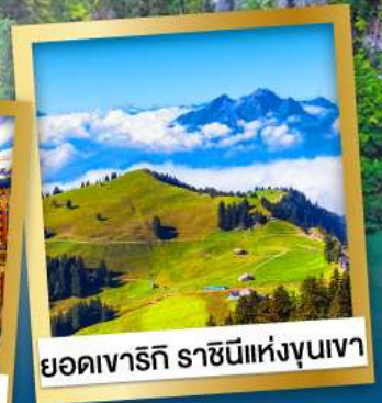
ยอดเขารักิ ราซินีแห่งขุนเขา