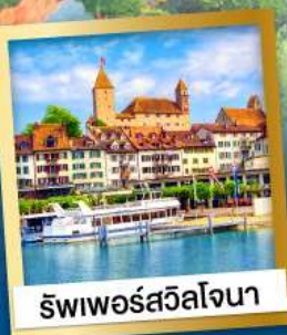
ริพเพอร์สวิลล์