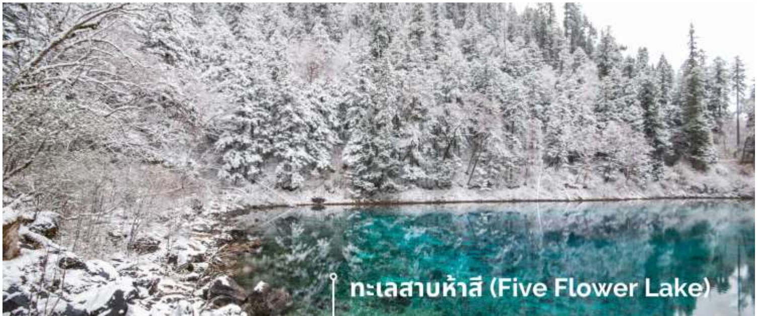
ทะเลสาบห้าสี (Five Flower Lake)

หนึ่งในจุดที่สวยงามและนักท่องเที่ยวแห่มาเยี่ยมชมเยอะที่สุด ตั้งอยู่ที่ความสูงเหนือระดับน้ำทะเลประมาณ 2,472 เมตร น้ำลึกประมาณ 5 เมตร น้ำใสจนเห็นพื้นด้านล่างของทะเลสาบ สีของผิวน้ำสวยงามแปลกตา โดยเฉพาะเมื่อยามแสงอาทิตย์สาดส่องกระทบผิวน้ำ สีของน้ำในทะเลสาบจะสะท้อนเป็นสีส้มถึง 5 เฉดสี สวยงามสะกดตา ซึ่งสาเหตุที่ทำให้เกิดสีสันต่างๆ นี้มาจากการสะสมของแร่ธาตุ และพืชน้ำชนิดต่างๆ โดยจะมีสีสันแตกต่างกันไปตามฤดูกาลและ