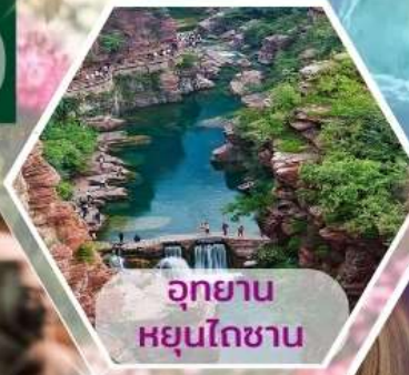
อุทยานหยุนโตซาน