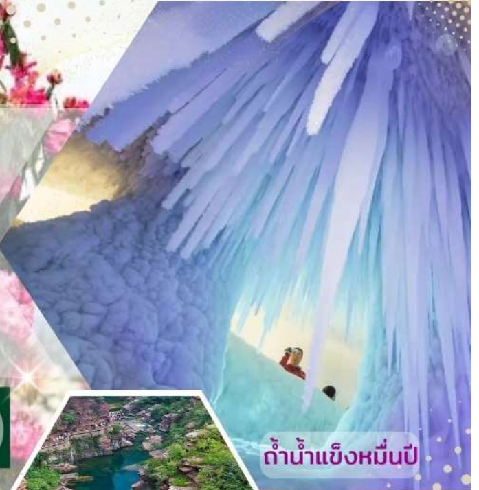
กำน้ำแข็งหมื่นปี