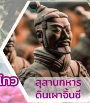
สุสานทหารดินเผาจีนซี