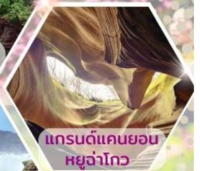
แกรนด์แคนยอนหยูจ่าโกว