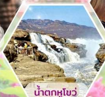
น้ำตกหูโซ่ว