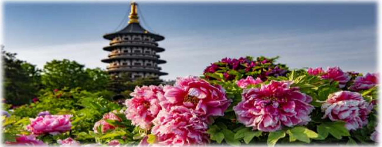
ที่พร้อมใจกันบานสะพรั่งมากมาย

จากนั้นนำท่านเข้า ชมสวนดอกโบตั๋น ที่จะมีจัดงานทุกปี ในช่วงฤดูใบไม้ผลิ ประมาณกลางเดือนเมษายน ถึงกลางเดือนพฤษภาคม โดยเทศกาลชมดอกโบตั๋นที่เมืองลั่วหยางถือว่าเป็น 1 ใน 4 เทศกาลดอกไม้ที่ใหญ่ที่สุดในจีนและมีชื่อเสียงมาก ๆ ในแต่ละปีจะมีนักท่องเที่ยวให้ความสนใจ กับความสวยงาม ของดอกโบตั๋น