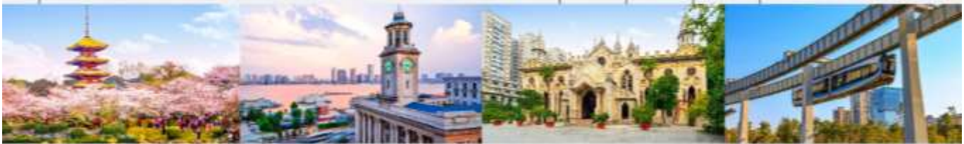
สวนชาทุระทะเลสาบโมซานตงหู