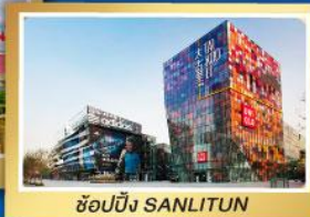
ช้อปปิ้ง SANLITUN