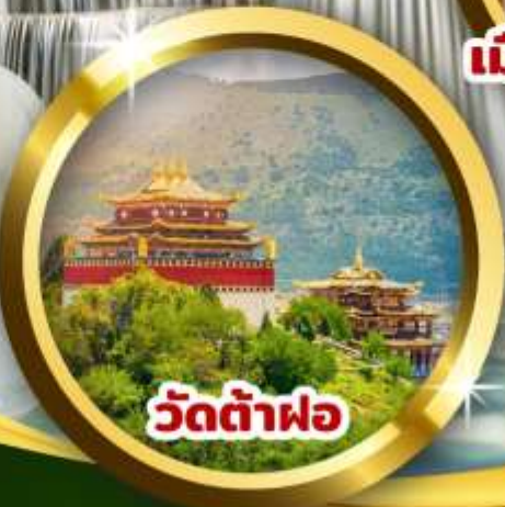
วัดต้าฝอ