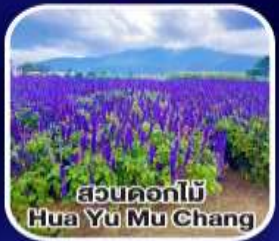
สวนดอกไม้ Hua Yu Mu Chang

01-05 เม.ย. 68 14,700 08-12 เม.ย. 68 19,700 15-19 เม.ย. 68 19,700 22-26 เม.ย. 68 16,700 29 เม.ย.-03 พ.ค. 68 18,700