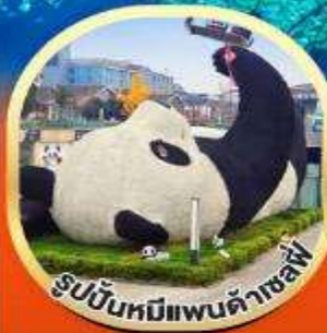
รูปปั้นหมีแพนด้าเซฟี่