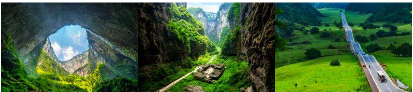
อุทยานหลุมฟ้า