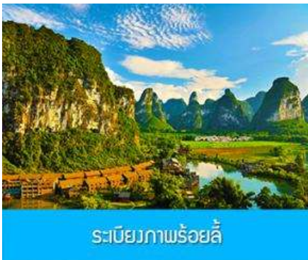
ระเบียงภาพร้อยลี้

พักที่ CHONGZUO YA STE HUAXI HOTEL โรงแรมระดับ 4 ดาวท้องถิ่น หรือเทียบเท่าในเมืองฉงจั่ว