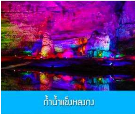
ถ้ำน้ำแข็งหลวง