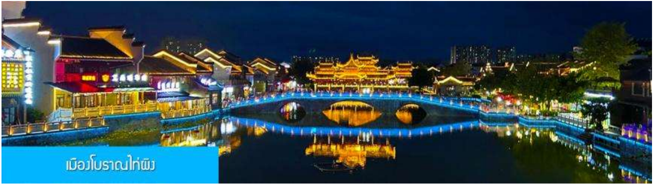
เมืองโบราณไค่ผิง