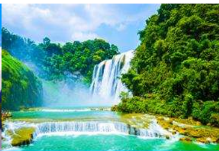
น้ำตกเต๋อเทียน