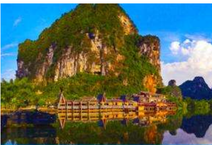
อุทยานหมิงซือ

พักที่ MINGSHI YISHU HOTEL ระดับ 3 ดาวท้องถิ่นหรือเทียบเท่าในอุทยานหมิงซือ