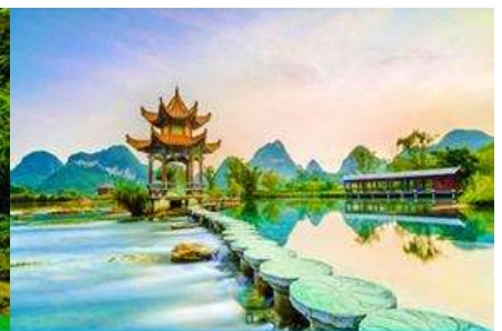
สวนน้ำพุเอ้อฉวน

วันที่สาม อุทยานหมิงซือ – น้ำตกเต๋อเทียน – สวนน้ำพุห่าน (เอ้อฉวน) เมืองจิ้งซี - เมืองโบราณจิ้นชิว