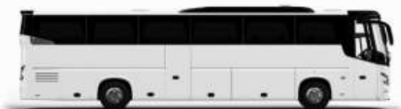
ตัวอย่างรถพลาท 1 ชั้น

ค่าที่พักตามที่ระบุในรายการหรือเทียบเท่าระดับเดียวกัน (ห้องพักละ 2 ท่าน) หากประเภทห้องพักที่ระบุไว้ไม่มีในรายการ เช่น วิววิวห้องพักเป็น TWIN BED หรือ DOUBLE BED ทางบริษัทขอสงวนสิทธิ์ในการปรับประเภทห้องพัก เป็นตามที่โรงแรมมีอยู่ โดยไม่ต้องแจ้งให้ทราบล่วงหน้า