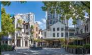
ย่านซินเทียนตี้

*ทางบริษัทฯ ขอสงวนสิทธิ์ในการสลับโปรแกรมทัวร์ตามความเหมาะสมขึ้นอยู่กับสถานการณ์หน้างาน โดยคำนึงถึงผลประโยชน์ของลูกค้าเป็นสำคัญ