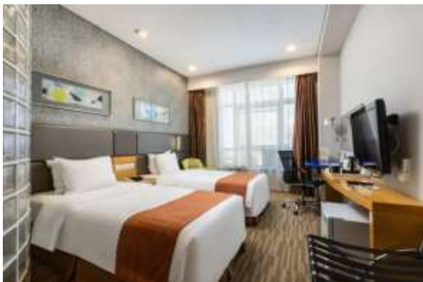
Holiday Inn Express Hotel