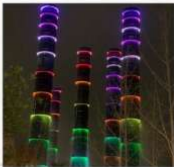
ชมแสงสีห้าง SKP