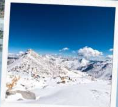
ภูเขาหิมะการ์เซีย ตำกู่ปิงชวน