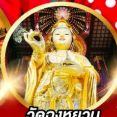
วัดหลงหยวน