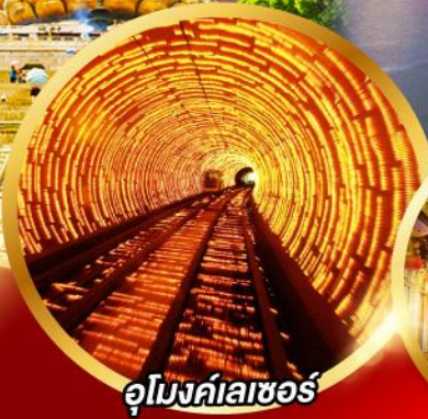
อุโมงค์เลเซอร์