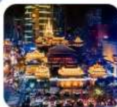
"วัดจิ่งอัน"