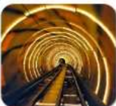
"ลอดอุโมงค์เลเซอร์"

เซี่ยงไฮ้ • ล่องเรือเมืองโบราณจูเจียเจี้ยว • นั่งรถไฟลอดอุโมงค์เลเซอร์ POP MART • วัดจิ่งอัน • อาคารพันต้นไม้ • ตลาดรอยปีเงินหวงเมี้ยว อิสระช้อปปิ้งเต็มวัน หรือ จะซื้อตั๋วเที่ยวดีสนีย์แลนด์