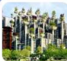
"อาคารพันต้นไม้"