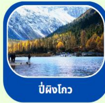
ป่าผิงโกว