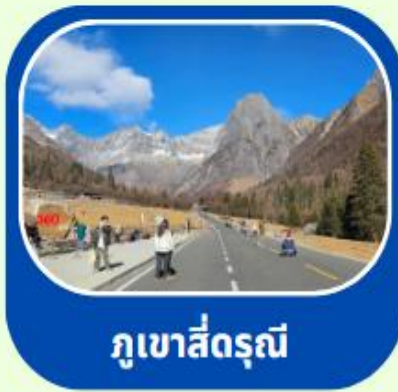
ภูเขาสีดรุณี