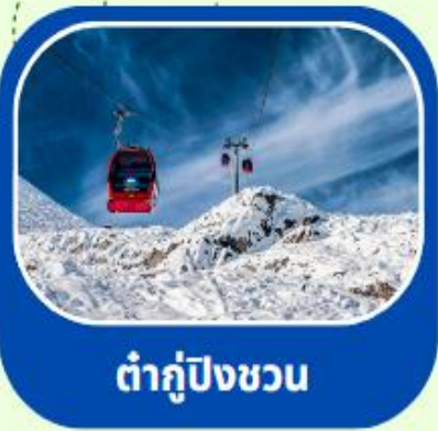
ต้ากู่ปิงชวน

ทัวร์ไม่ลงร้าน+ไม่ขายออฟชั่น+บินFullService