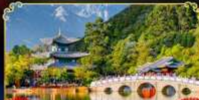
สระมิงกรต้า