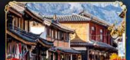
เมืองโบราณไปซา