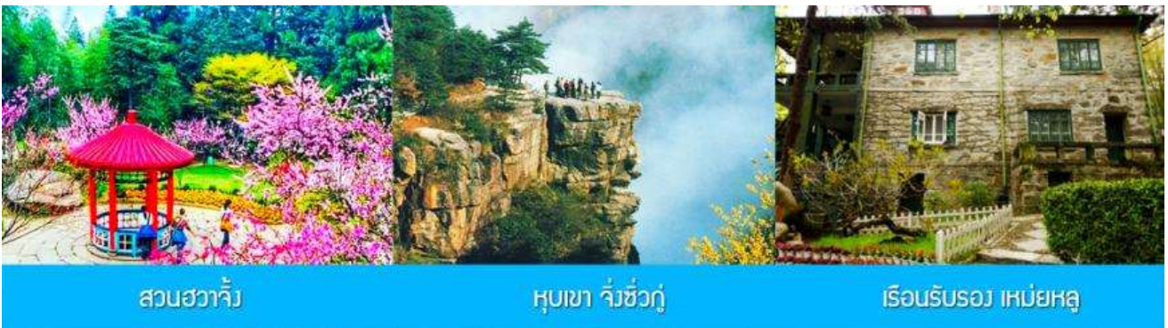
สวนฮวาจิ้ง