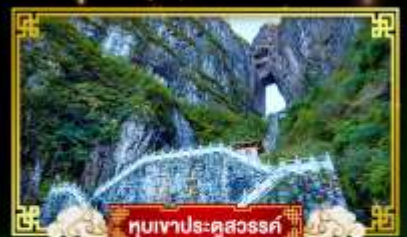
หุบเขาประตูสวรรค์