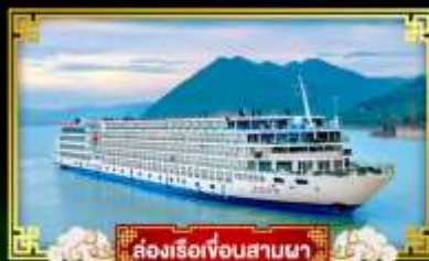
ล่องเรือเจ็อนสามผา