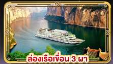
ล่องเรือเขื่อน 3 ภา