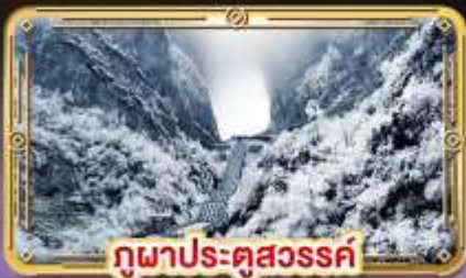
ภูเขาประตูสวรรค์