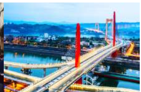
เมืองหยีซา