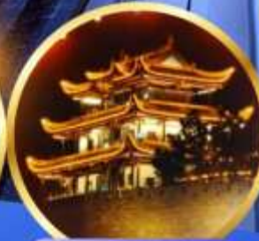
หอคอยทองคำเทียนจิน