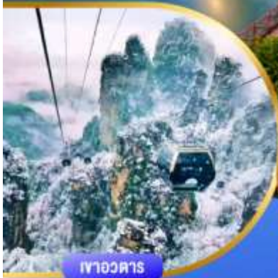
เทาอวดตาร