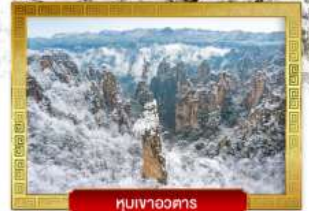
หุบเขาอวตาร