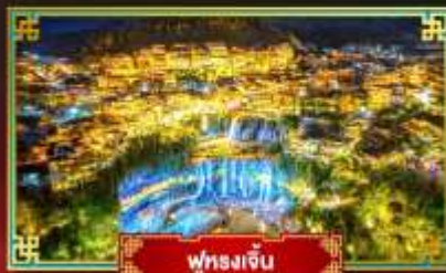
ฟุหลงเจิ่น