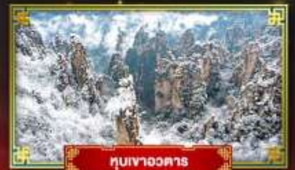
เทียนจื่อซาน