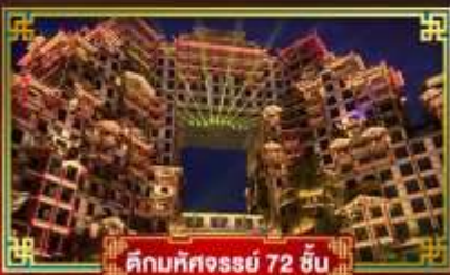
คิมทึคจอร์จี่ 72 ชั้น

นั่งกระเช้าขึ้นประตูสวรรค์ เทียวหมู่บ้านโบราณ