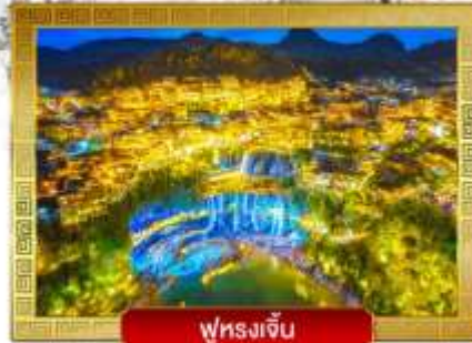
ฟุรงเจิน