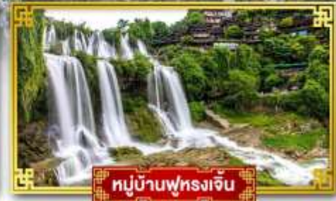
หมู่บ้านฟุทงเจิ้น