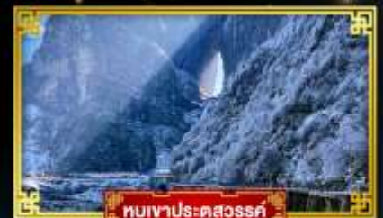
ทิวเขาประตูละคร