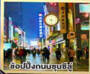
ช้อปปิ้งถนนชุนชี่สี่