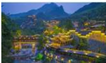
หุ่นเขาเทวดาวิ่งเซียนทู่