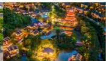
หมู่บ้านเกอเซียน

*ทางบริษัทฯ ขอสงวนสิทธิ์ในการสลับโปรแกรมทัวร์ตามความเหมาะสมขึ้นอยู่กับสถานการณ์หน้างาน โดยคำนึงถึงผลประโยชน์ของลูกค้าเป็นสำคัญ