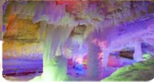
ถ้ำน้ำแข็งหมื่นปี