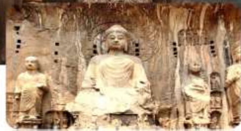
ถ้ำปาหลงเหมิน

เมนูพิเศษ เกี่ยวซีอาน เปิดอย่างซีอาน สุกี้ซีอาน 7 วัน 5 คืน เดินทาง : 11-17 เมษายน 68