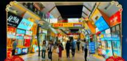
ถนนจินเจีย