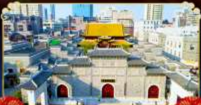
ถนนโบราณวังโซ่งกง

เยือนหมู่บ้านริมผา “หมู่บ้านเทวดาวังเซียนกู่”