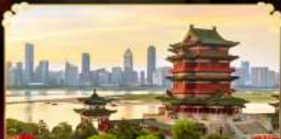
หอถึงหวังเก้อ