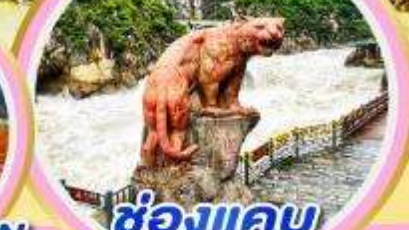
ช่องแคบ เสือกระโจน