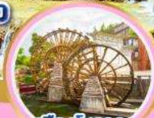
เมืองโบราณ ลี่เจียง