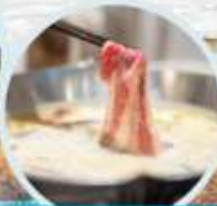
เมนูพิเศษ สุกี้หม่าล่า