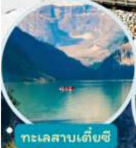
ทะเลสาบเต๋ยซี