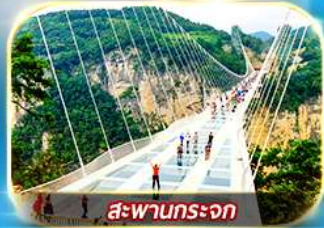
สะพานกระเจก