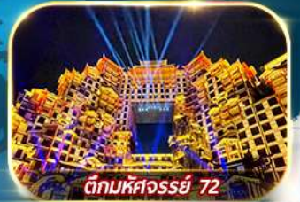
ตึกมหัศจรรย์ 72

เต็มอิ่มกับบรรยากาศเมืองโบราณเฟิ่งหวง เขาเทียนเหมินซาน ประตูสวรรค์ หมู่บ้านโบราณบนน้ำตกฟุหลง