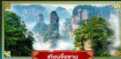
เทียนจ้อซาน