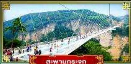
สะพานกระจก

สัมผัสบรรยากาศหมู่บ้านโบราณ ชมหุบเขาอวตาร