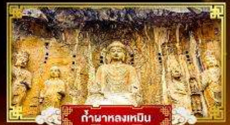
กำแพงหลงเหมิน