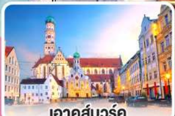
เอาคส์บวร์ค